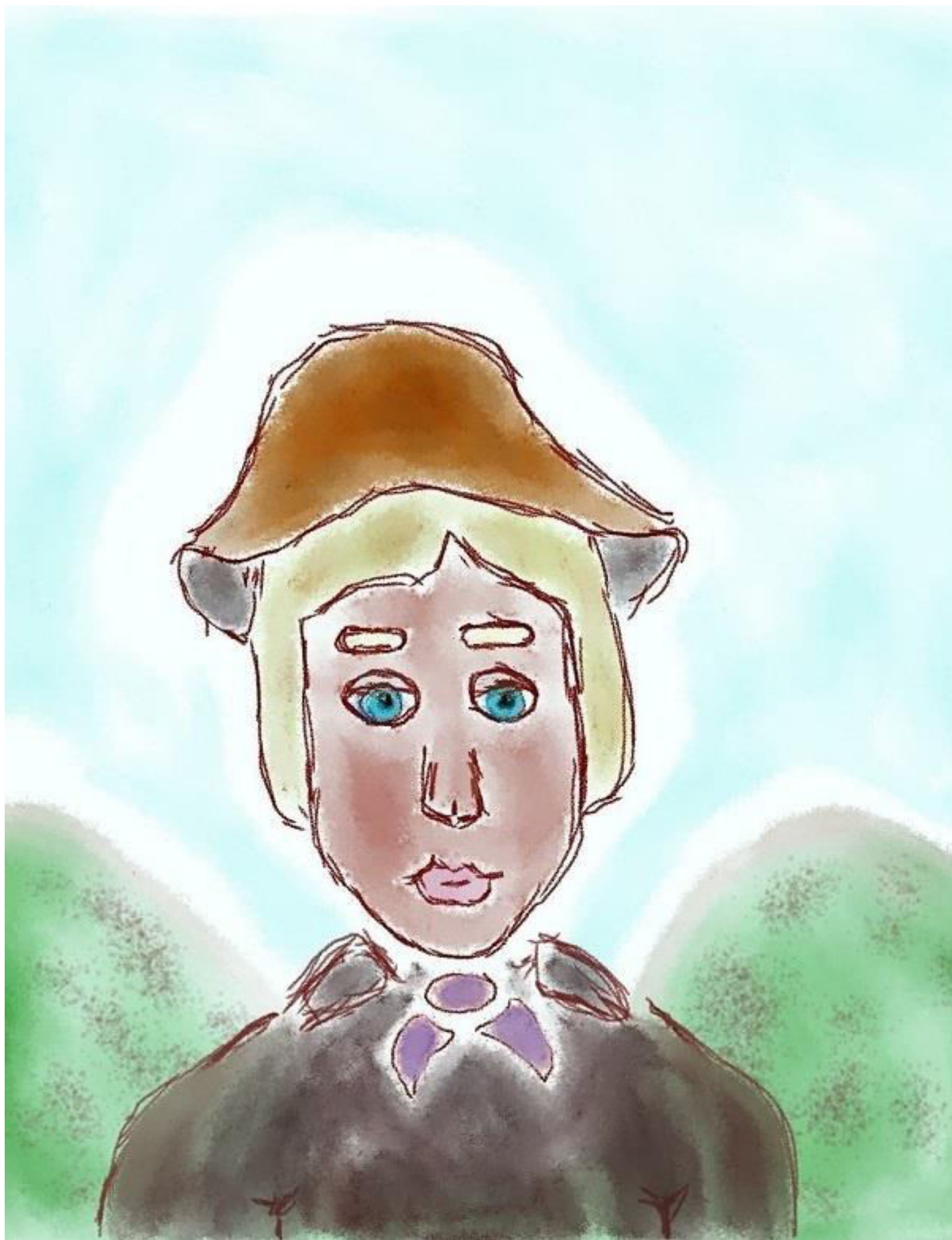
O dobrom drakevi Filipovi