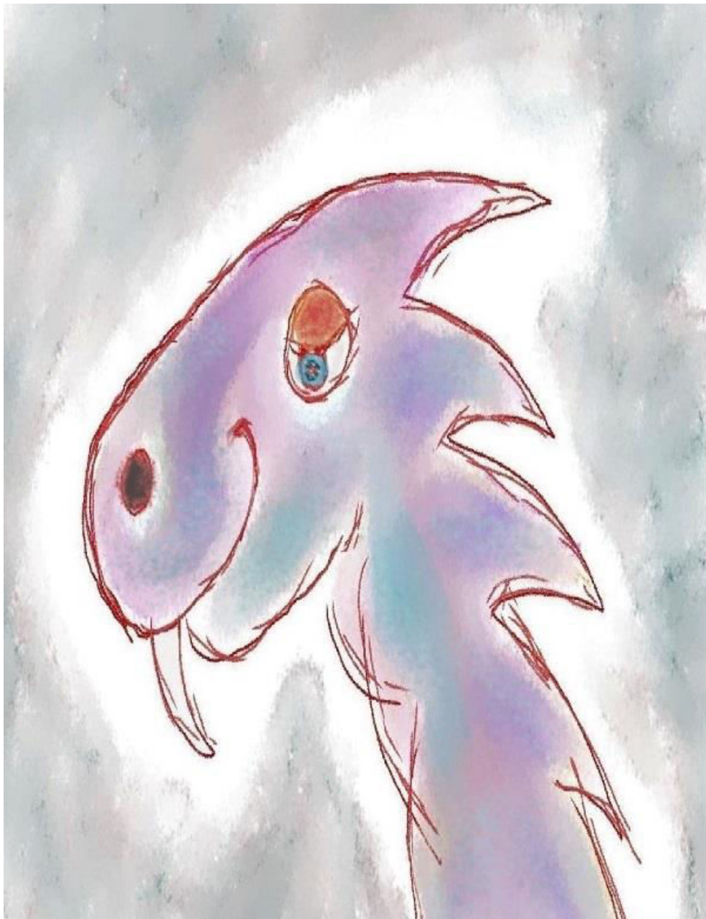
O dobrom drakevi Filipovi